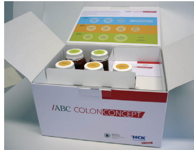
Das IABC® ColonConcept Therapiepaket

für ein Therapiepaket. Nachdem Sie zusammen mit Ihrem Therapeuten die Zusammensetzung bestimmt und bei uns bestellt haben, erhalten Sie Ihr individuell zusammengestelltes IABC® ColonConcept Therapiepaket.